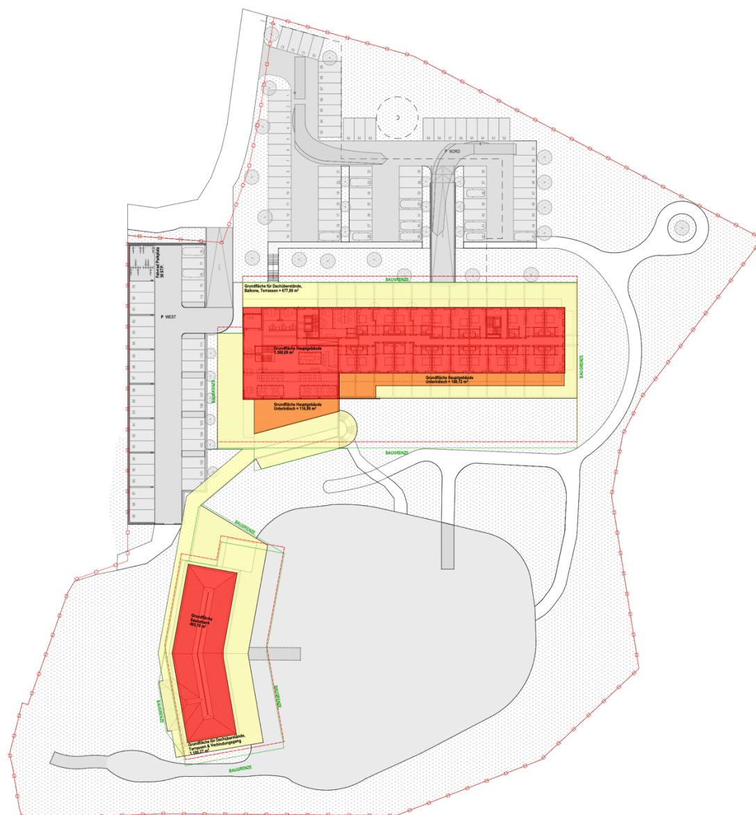
Abb. U-1 Prüfbereich (rote Umgrenzung) des Umweltberichts , Straßerhof', Plandarstellung gem. HP Ingenieure ,Lageplan mit Umgriff B-Plan, Stand 07.08.2025' (Hinweise: Darstellung unmaßstäblich, rot/orange = Grundfläche der Gebäude (ober- / unterirdisch, gelb = Grundfläche mit Dachüberständen, Balkonen, Terrassen und Verbindungsgang, grau = Nebenanlagen und Außenbereich)