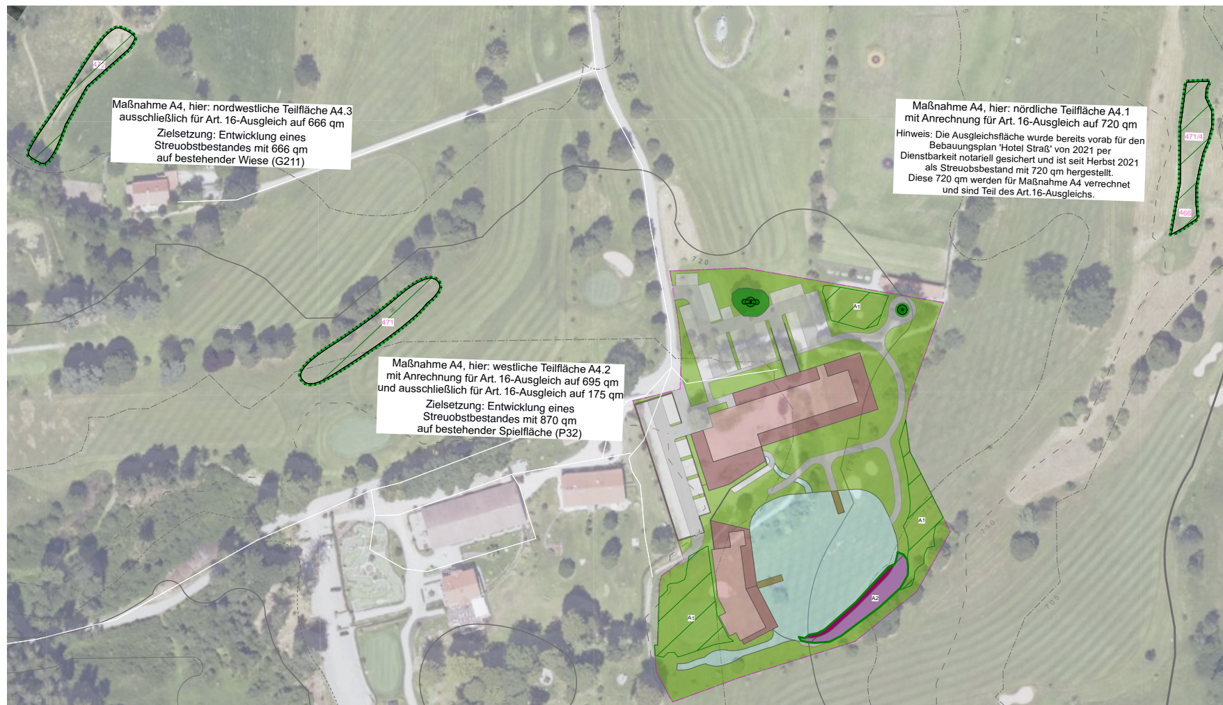
Abb. U-3 Ausgleichsflächen-Plan, im Rahmen der Grünordnung, unmaßstäblich (Luftbild 2023 mit bestehenden Spielbahnen, grün: festgesetzte Ausgleichsmaßnahmen A4: A4.1, A4.2 und A4.3)